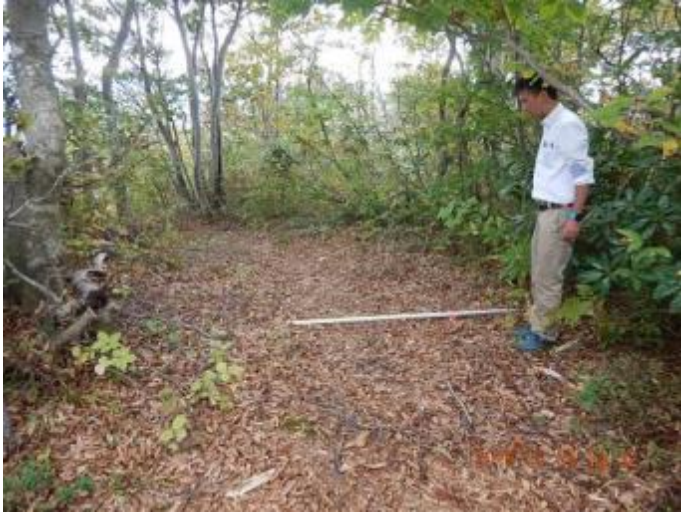
鳥野ガ峰終点 手入れがされている