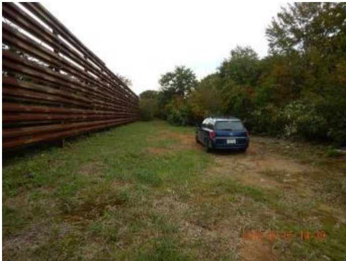
鳥屋ガ峰雪庇吹払い柵