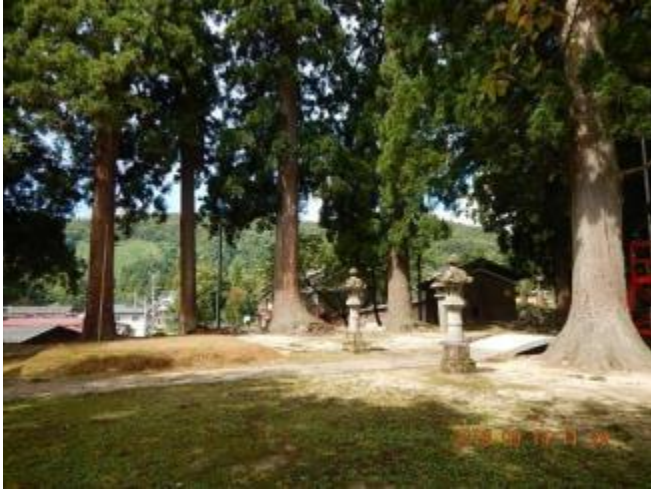
小平尾登山口菅原神社