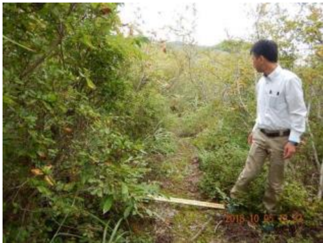
小峯神社より鳥野ヶ峰を望む