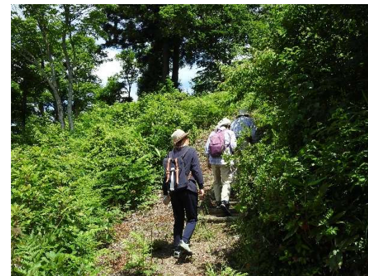
休憩場所から山へ入って行く。