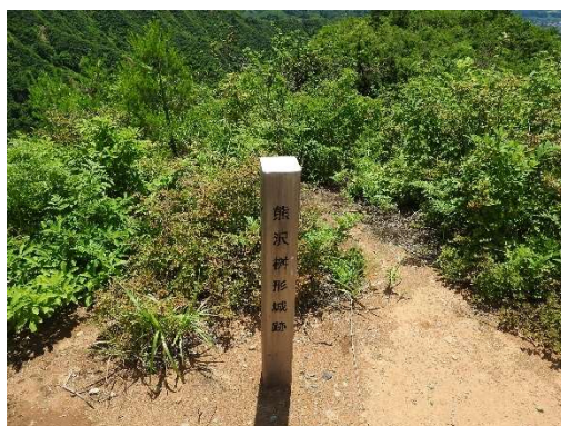
熊沢柵形城跡標識 (第一展望台)