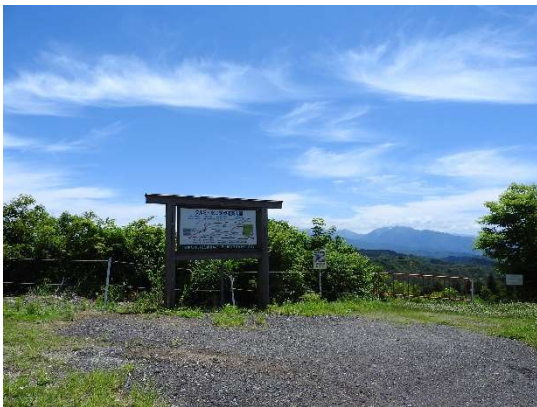
看板てまえには、車が数台駐車できる駐車場 スペースがある。