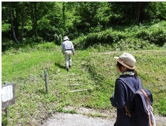
クルミ遊歩道登り口へ向かう