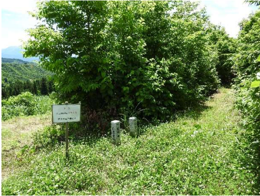
終点(起点)にある標識。 (遊歩道の案内標識と田毎の月の案内標識)