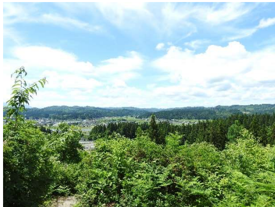
休憩場所からの眺め。