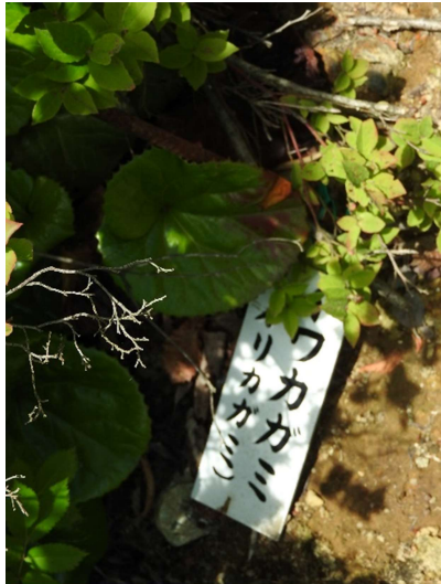
イワカガミのプレート