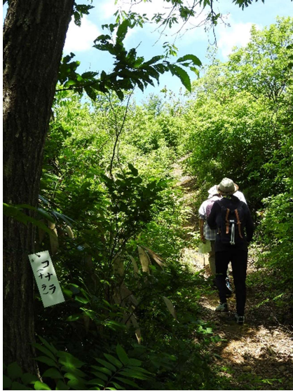
コナラのプレート