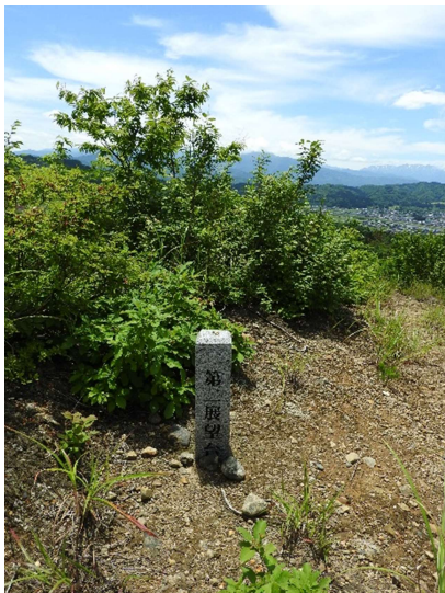
第二展望台に到着。