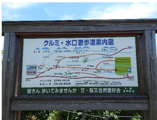
終点にあるクルミ・水口遊歩道案内図。