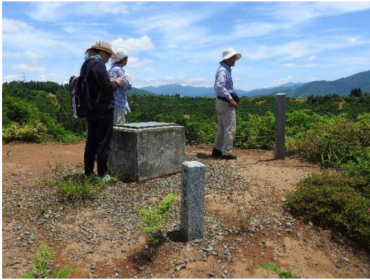
第一展望台に到着。