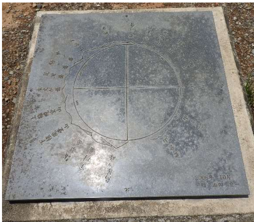
周辺の山々の案内板 (第一展望台)