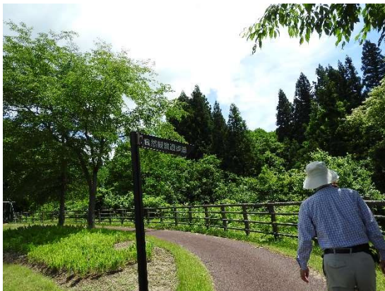
自然観察遊歩道を上っていく。