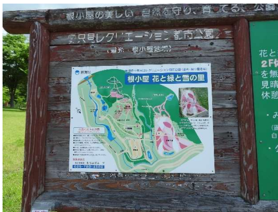
奥只見レクリエーション都市公園 根小屋 花と緑と雪の里