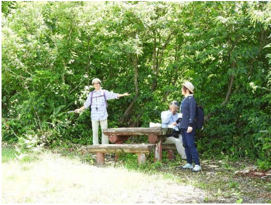
公園内の最も高い所にある休憩場所。