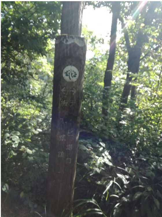
テレビ塔への標識が現れる。