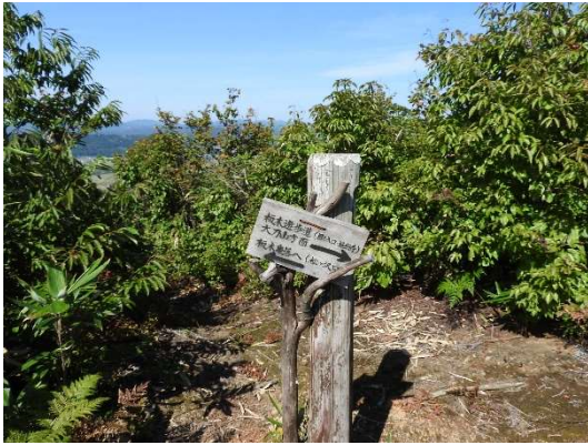
板木集落方面、大力山方面と書かれた標識。