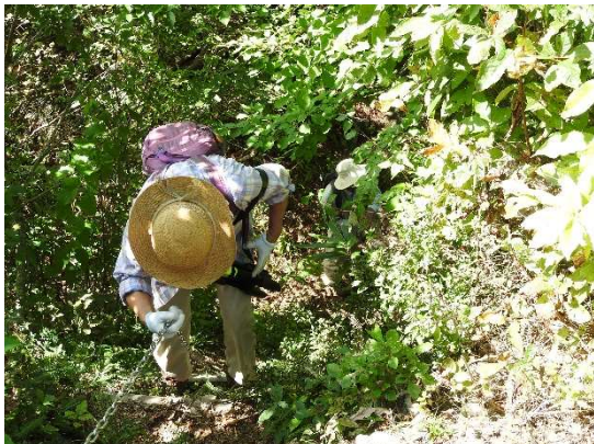
ロープの代わりに鎖が使われている所もある。