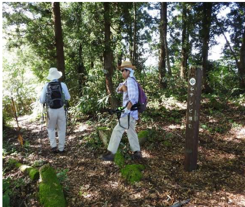
テレビ塔口への標識