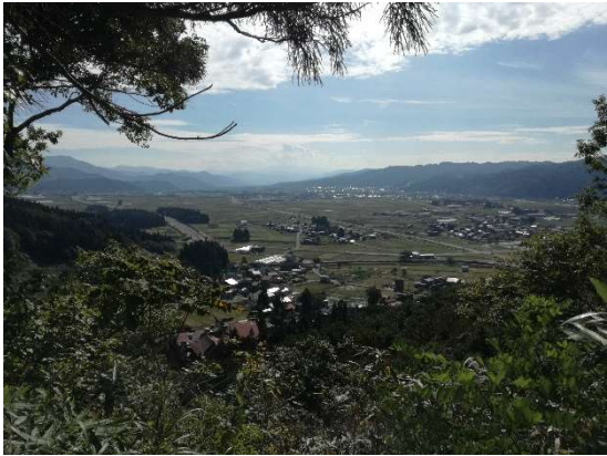
眼下に大浦の集落。