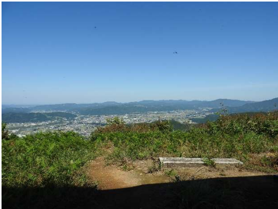
山頂から右手に見える魚沼市街。