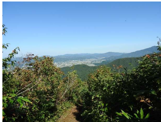
山頂が近くになるにつれて、景色が開けてくる。