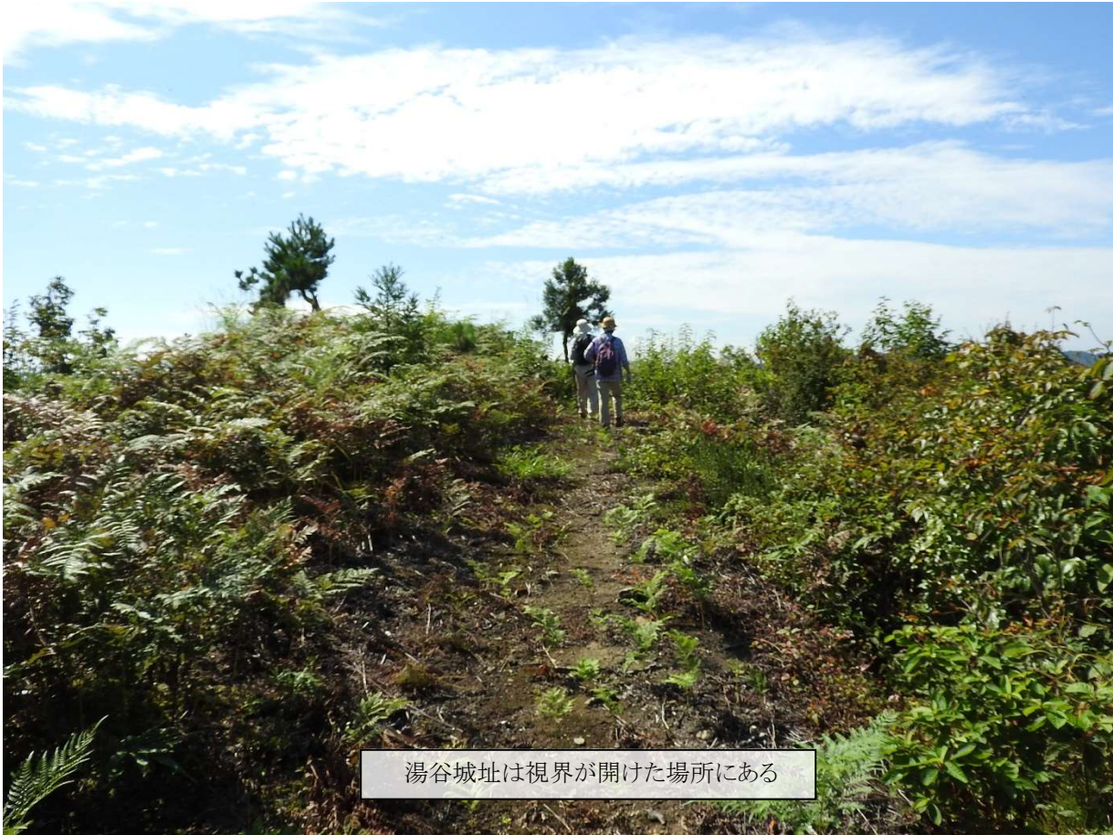
湯谷城址は視界が開けた場所にある