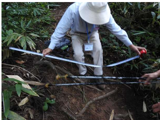
遊歩道は幅約 1.5m 位に整備されている。