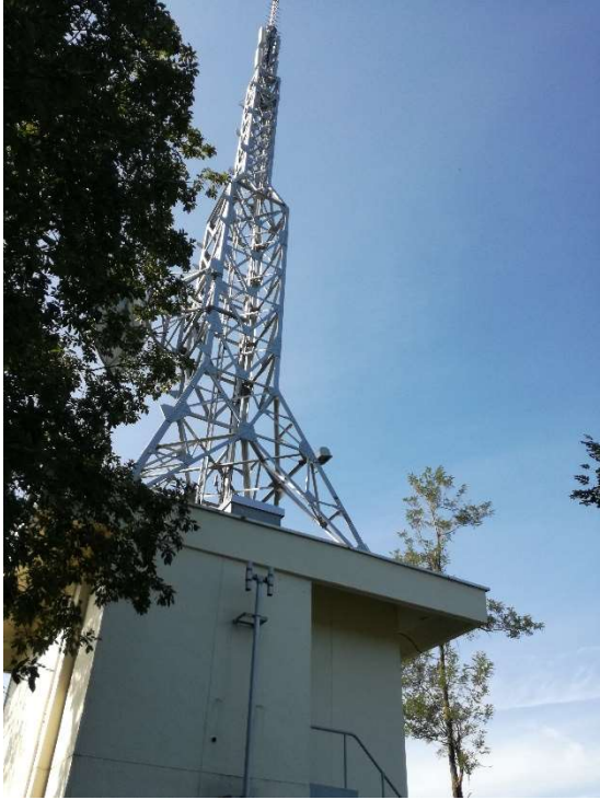
一つ目のテレビ塔へ到着。 NHK だと思われる。