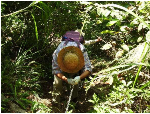
板木城跡からはほとんど下り。