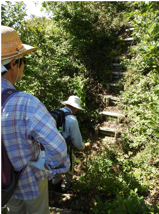
板木城跡へ向かう途中、壕を掘ったようなところがいくつかあるが、これがその中の一つ。写真ではわかりにくいかもしれないが、人工的に深く掘り込んだようになっている。これは、城の名残であろう。