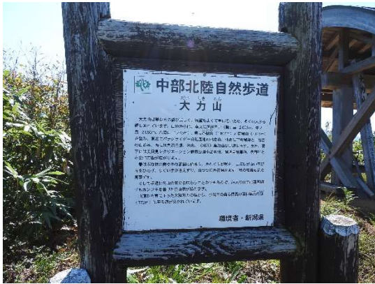
中部北陸自然歩道の看板。