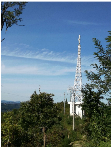
2つ目のテレビ塔。 民放と思われる。