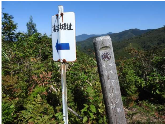
湯谷城址への看板。