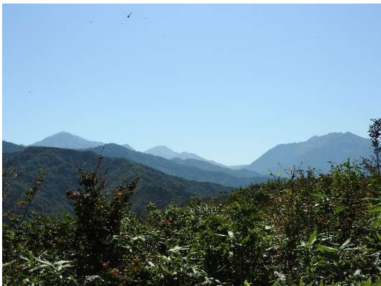
山頂から見える山々は左から、駒ヶ岳、中ノ岳、八海山。