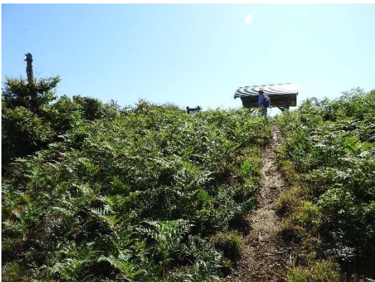
山頂の東屋が前方に見えてくる。