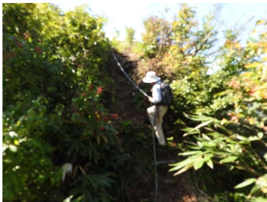
傾斜が急な所には、ロープが取り付けられている。