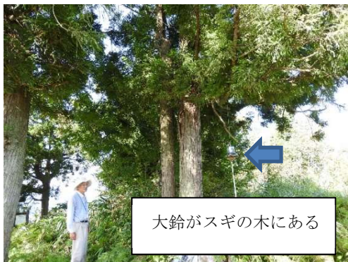
大鈴がスギの木にある