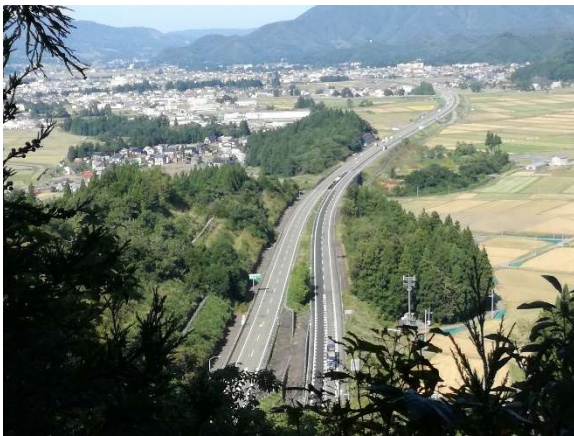
関越自動車道(高速道路)の城山トンネルの真上を歩く。