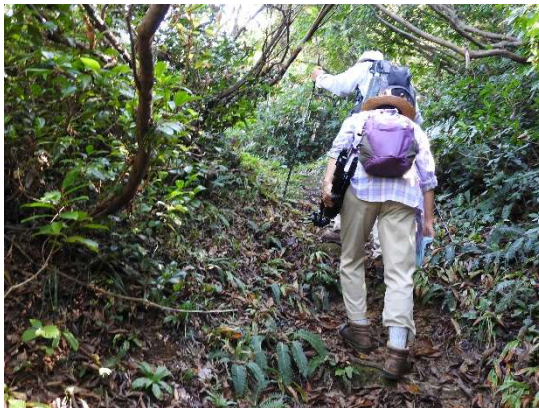
登山道は両側に人間の伸長より高い雑木が多くあるため、太陽光が強い日でもあまり直射日光を受けることなく登ることができる。