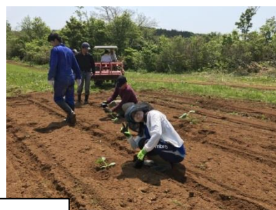
少しのお勉強と、畑での野菜作りもやります