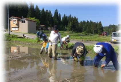
手でも機械でも植えちゃいます

【持ち物】作業着(長袖),長靴,帽子,手袋,雨具,上着,着替え,虫よけ,健康保険証など